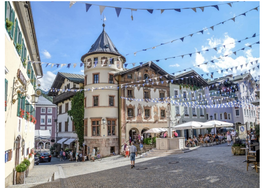
Bild: Berchtesgaden, Ortskern

Liebe Gäste, wir haben wieder einen bunten Mix an Veranstaltungen für Sie im Angebot. Wir wünschen Ihnen unterhaltsame Stunden und schöne Naturerlebnisse in und um Bad Vigaun. Viel Vergnügen!